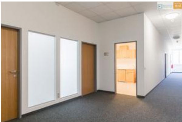
Eingang und Küchentür