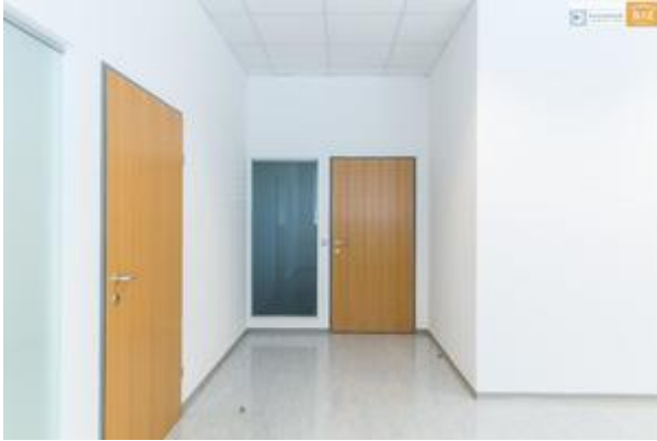
Ausgangs- und Verbindungstüren