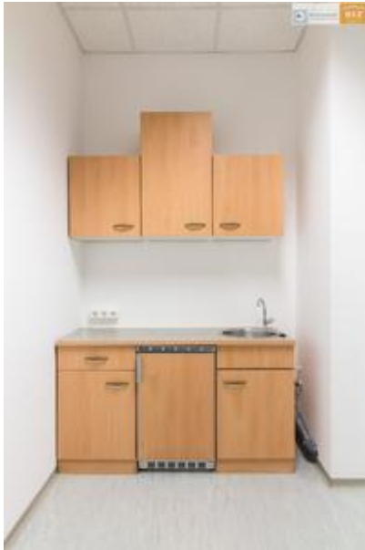
Küche im extra Raum