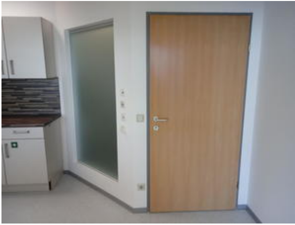
Zugang zum Gang und Glasfront